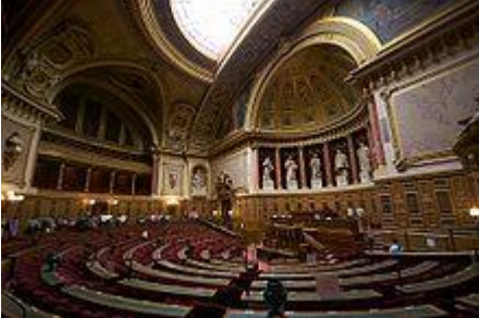
Photographie du lieu de réunion

Le Sénat constitue la chambre haute du Parlement français selon le système du bicamérisme . Il détient le pouvoir législatif avec l' Assemblée nationale . En vertu de l' article 24 de la Constitution de la V e République , il est le représentant des collectivités territoriales et, avec l'Assemblée nationale, des Français établis hors de France . Il siège au palais du Luxembourg .